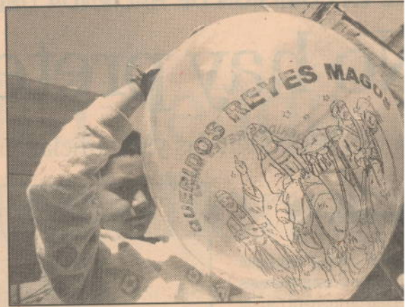
Este año se endeudarán más. (Hugo Salazar)